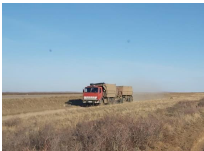
Figure – 3. Truck from Karazhyra Coal Company in the Semipalatinsk test site.