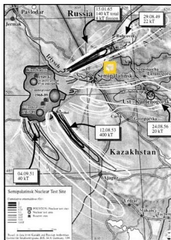
Figure-1. Semipalatinsk Nuclear Test Site.

Regarding the Soviet era, the environment was not treated as a separate domain within government management until significant reforms were enacted following the enactment of the Law on Nature Protection on October 27, 1960. It was from this point onwards that genuine efforts to safeguard the environment were observed. In 1961, the establishment of the Commission for Nature Protection under the USSR State Planning Committee marked a pivotal moment, and in 1964, the USSR Ministry of Agriculture initiated the Central Laboratory for Nature Conservation. [8].