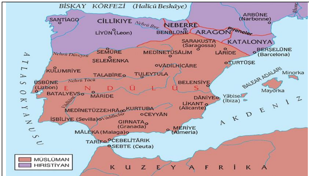
Сурет 1. Андалусияның орналасқан картасы: https://islamansiklopedisi.org.tr/endulus#1

Андалусияның саяси тарихы негізінен алты кезеңге бөлінеді. Енді бұл кезеңдерді қысқаша қарастырайық [5. s. 223].