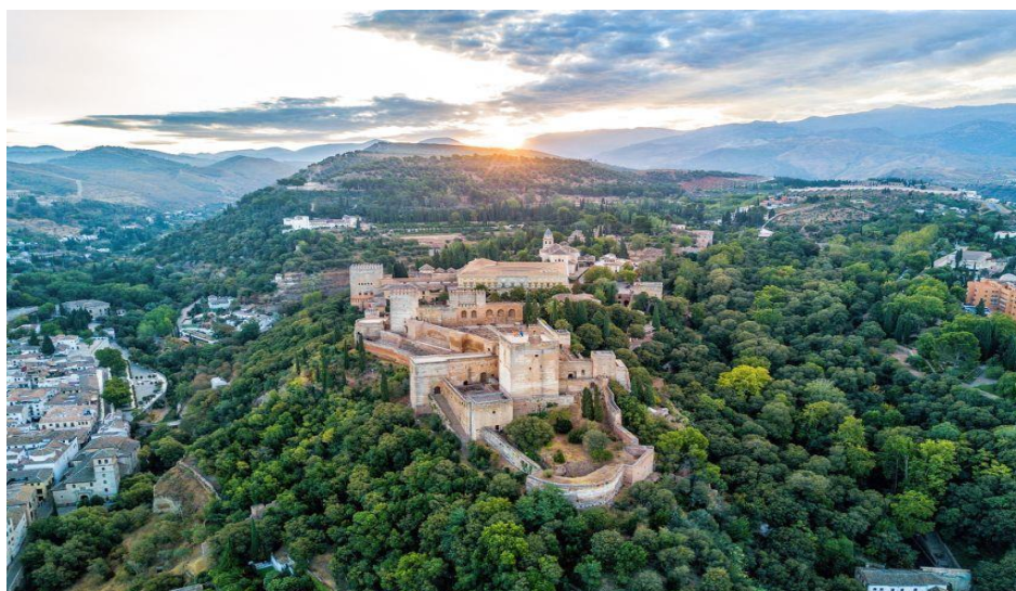
Сурет 2. Андалусия Ислам мемлекетінің алыстан көрінісі