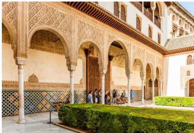
Сурет 3, 4. Әл-Хамра сарайы

Қорыта айтқанда, аймақта Андалусия Әмәуилерінің үстемдігі 11 ғасырдың басына дейін жалғасты. Сондай-ақ 1031 жылы халифалық басқару аяқталып, Андалусия жерлері көптеген тәуелсіз мемлекеттерге бөлінді. Бұл мемлекеттер де өзара келіспеушіліктерге тап болып, қақтығыстар орын ала бастады. Осы қақтығыстарды пайдаланып, Испанияның христиан мемлекеттері де шабуылдарын үдете түсті. Бұл жағдай испан тілінен аударғанда «қайта жаулап алу» деген мағынаны білдіретін Реконкистаны тездетіп, Испаниядағы исламның ықпалы әлсіреді.