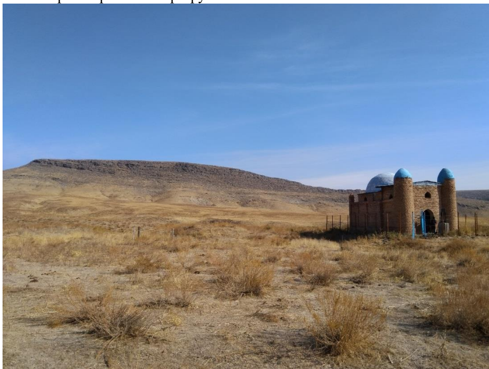
Рис. 1. Мавзолей Толена на фоне горы Огизтау.

К сожалению часть стены главного фасада (в некоторой части почти до основания), верхушка башен и перекрытия первой камеры были разобраны в 1954-1955 гг. для возведения памятника Сталину жителем близлежащего села Серт. В 1999 г. на средства потомков Толена ряд разобранных частей мавзолея были восстановлены [14, 237 б.]. Остается неизвестным перекрытие входного помещения, которое в настоящее время выполнено из современных материалов. Стрельчатый вход и ниша - световой проем с прилегающими участками в фасадной части также относятся к вновь восстановленной части мавзолея. Остальные три фасада мавзолея являются оригинальными. Они декорированы прямоугольными филёнками (Рис. 3). В верхних частях памятника местами кирпич крошится и разрушается.