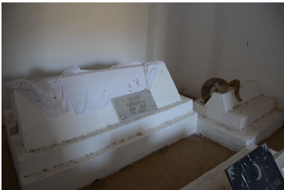
Рис. 5. Надгробия в усыпальнице мавзолея Толена.

Согласно рассказам потомков Толена отец Төлена Қарабай проживал в районе Алтынтау, Кумісті, Аксумбе на северных склонах Караиау. После смерти отца Толен возглавил группу рода Божбан. Он был инициатором покупки урочища Огузтау за 350-400 баранов и перемещения своих сородичей в новый район, расположенный близко к г. Туркестану. При жизни Толена в период Кокандского ханства его сын Кобелек (Муса) становится волостным правителем. После смерти отца именно Кобелек заказал строительство мавзолея Толена. В настоящее время более 150 семей являются потомками Толена [14, 236-237 бб.].