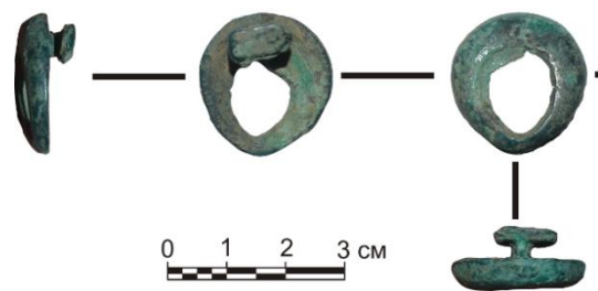
Рис. 2. Бронзовая застежка. Курган №34