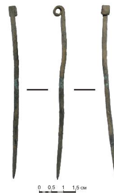
Рис. 3. Бронзовая шпилька. Курган №34