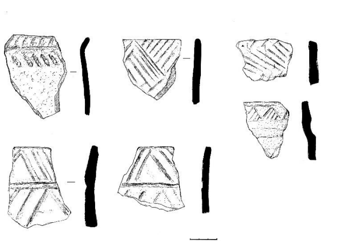
Сурет 2. Жалғыз ағым қонысы. Арал аудантық тарихи-өлкетану музей қорында сақталған қола дәуірінің қыш ыдыстары