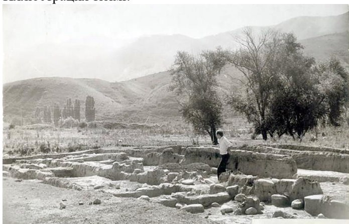
1. Сурет. Талғар қалашығындағы археологиялық қазба И.И. Копылов жетекшілік еткен, XX ғасыр 50-60 жылдар архивтік фотосурет.