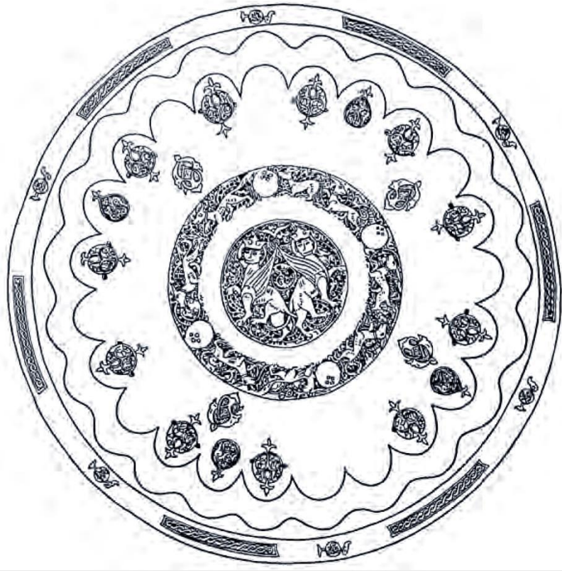
4. Сурет. Ирандық мифологиялық ою-өрнегі бар тағам, Талғар қалашығының шығыс маңы, XII - XIII ғасырдың басы.