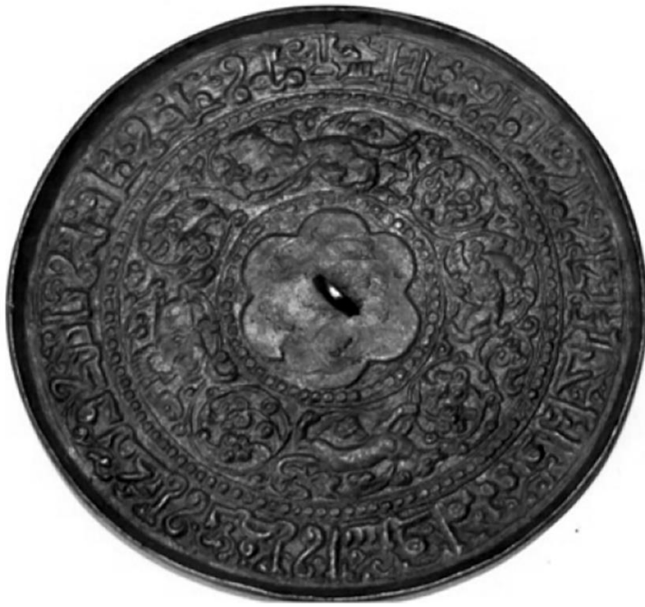
2. Сурет. XII - XIII ғасырдың басы Иранның қола айнасы, «жануарлар жарысы» рельефтік көрінісі және араб жазбасымен безендірілген. Талғар қалашығы.