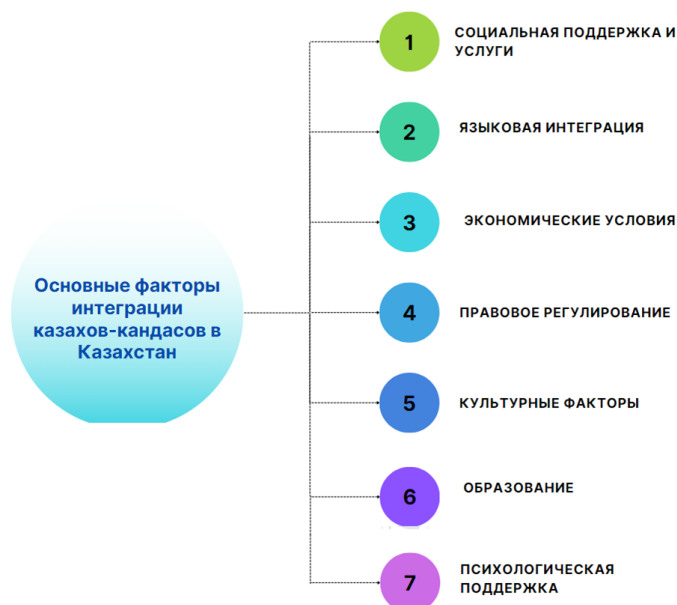
Рисунок 2 – Основные факторы интеграции кандасов в Казахстан Примечание: составлено авторами на основе источника [33, с. 170-182]

Система социальной поддержки выступает одним из центральных факторов успешной интеграции кандасов. В рамках государственных и частных программ социальной помощи репатрианты получают возможность доступа к жилым помещениям, медицинскому обслуживанию и целевым финансовым выплатам, что существенно облегчает их адаптацию в новых условиях. Специализированные социальные службы, организующие обучающие семинары, профессиональные тренинги и консультативные сессии, выполняют функцию посредников в интеграционных процессах, способствуя формированию у вновь прибывших необходимых навыков и знаний для эффективного включения в общественную и экономическую жизнь Казахстана.