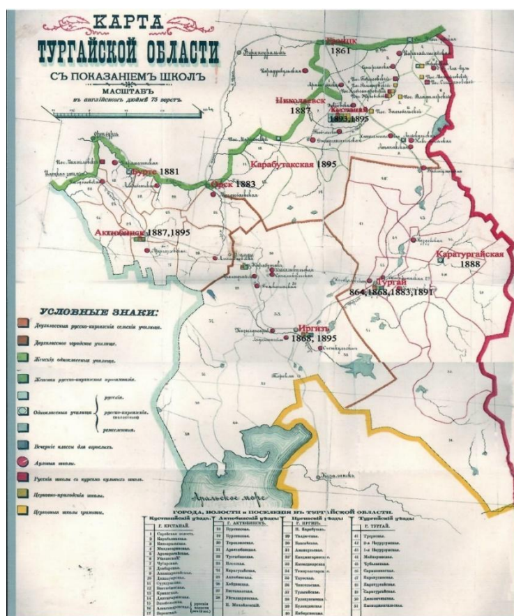
Рис. 4. Карта Тургайской области с показанием школ. - Россия, конец XIX. - 1 л. цв. Масштаб: 75 верст в английском дюйме [28].

- Образован педагогический класс в Кустанае. Министерство финансов уважило ходатайство Тургайского областного начальства об открытии в г. Кустанае педагогического класса для подготовки учителей в казахские школы и вошло с представлением в Государственный Совет об ассигновании на областных земских сумм по 3000 руб. ежегодно, начиная с 1896 г. [27].