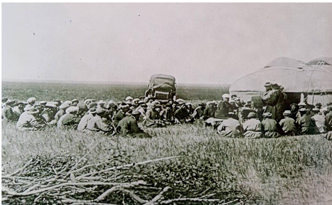
Рис. 3. Выборы должностных лиц. Начало XX в. [22].

Волостной управитель являлся чиновником Российской империи и его жалованье назначалось от 350 рублей до 430 рублей в год в зависимости от величины волости.