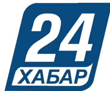
Сурет-4. Хабар 24" телеарнасының логотипі

Қазіргі уақытта телеарна ресми сайтта ақпараттық, ақпараттық-сараптамалық, репортажды ақпараттық-қойылымдық, репортажды ақпараттық-сараптамалық, репортажды ақпараттық, қойылымдық сұхбат пен имидждік роликтер бағытындағы жаңа телевизиялық жобаларды шығару үшін серіктес продюсерлік компанияларды іздестіруде. Ендеше, қазақстандық көрермен аудиториясы үшін қызықты болуы тиіс жобалардың көбеюін күтеміз.