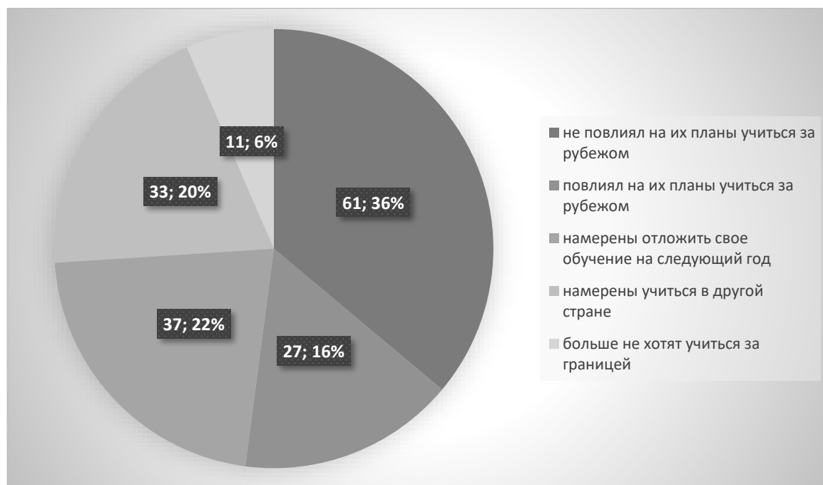
Рис. 3. Результаты опроса Британского агентства ранжирование университетов QS

Кроме того, 33% заявили, что теперь они намерены учиться в другой стране, и только 11% заявили, что больше не хотят учиться за границей.