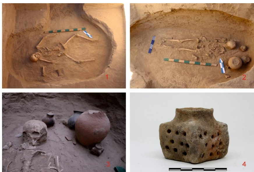
5-Сурет. 1 - №10 обада ромб қалпында жатқан қаңқа. 2 - №11 обада жатқан қаңқа. 3 - №11 обадағы қаңқаның бас жағында тұрған о дүниелік тарту таралғылар. 4 - №11 обадан табылған аластау ыдысы (курулница)

№12 обада жүргізілген қазба жұмыстары кезінде «Т» түріндегі катакомб қабір анықталды. Камераның ішкі кеңістігін тазалау кезінде шалқасынан созылыңқы қалыпта жатқан бір жас жеткіншектің қаңқасы анықталды. Қазба жұмысы барысында камераға кіреберіс ауыздан көлемі кіші қола қоңырау табылса, камерадан қоладан жасалған жүзік, қола әшекей бұйым, тастан жасалған құс бейнесінде моншақ (тұмар), екі дана саз ыдыс (біреуі торсық тәрізді) табылды.