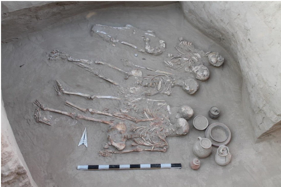
2-Сурет. №3 обадан табылған қаңқалар.

А.Н.Подушкиннің ішін ара келіп қазған обаларын айтпағанда 2017 жылдан кейін бұл қорымда зерттеу жұмыстары жүргізілмеді. 2022 жылы М.Гурсой тарапынан дайындалған «Келес өзенінің төменгі ағысындағы обаларды археологиялық және пәнаралық ғылымдар аясында зерттеу» атты ғылыми жобасы Ғылым және жоғары білім министрлігі тарапынан қаржыландырылғаннан кейін қазба жұмыстары қайта жалғасын тапты. Қазба маусымында №6 обадан шеңбер пішінді бір камералы наус аршылды. Бұл наустың құрылысына пахса және кесек қолданылған. Диаметрі 5,5 м, сақталған биіктігі 1,38 м шамасын-да. Дромосы солтүстік батысқа бағытталған. Камера мен дромостың ішкі беті лаймен сыланған. Қазба жұмыстары кезінде үйінді арасынан ірі көлемді саз ыдыс бөліктері табылды. Камераның шығыс қабырға-сы жанынан бір қаңқамен қоса орталық бөліктен шашылып жатқан жекелеген адам сүйектері анықталды. Бастапқы қалпын сақтаған қаңқа шалқасынан жатқызылып басы оңтүстікке бағытталған. Камерадан бір дана түссіз мөлдір моншақтан басқа ешқандай олжа табылмады. Нәтижесінде бұл обаның тоналғандығы белгілі болды [2, 144].