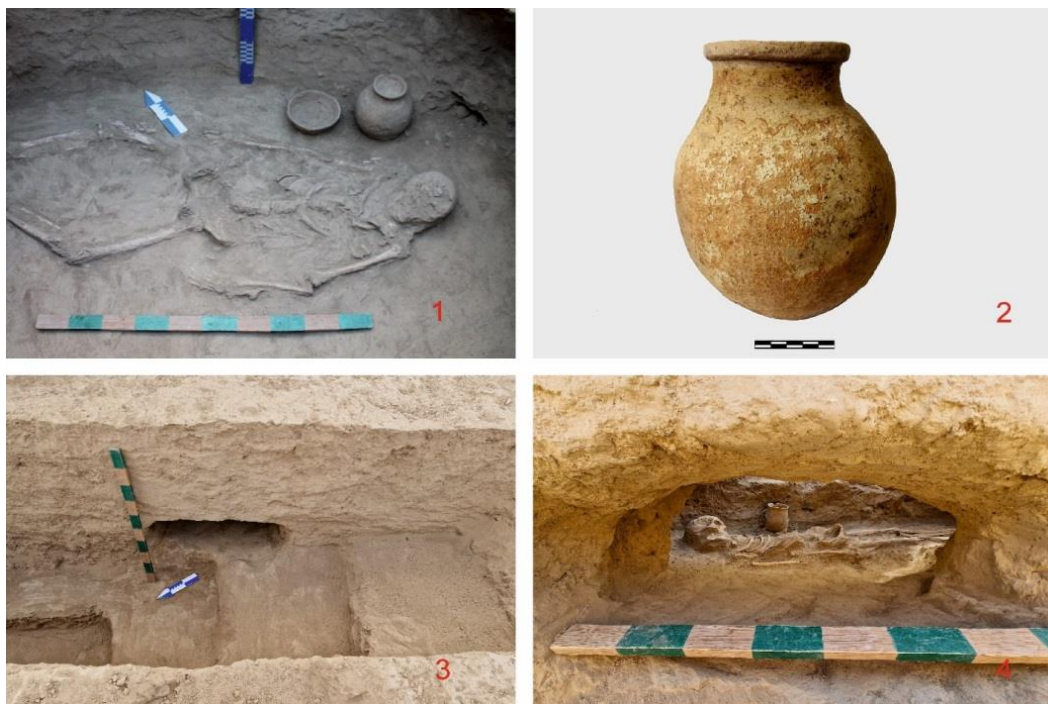
4-Сурет. 1 – ромб қалпында жатқан қаңқа. 2- Камерадан табылған құмыра. 3 – Дромостың оң жақ қапталынан арышылған жанама қабір (подбой). 4 – Жанама қабірде жатқан қаңқа.

№11 обада жүргізілген қазба жұмыстары кезінде «Т» түріндегі катакомб қабір анықталды. Камераның ішкі кеңістігін тазалау кезінде шалқасынан созылыңқы қалыпта жатқан бір қаңқа табылды. Қаңқаның бас жағынан бір құмыра, бір торсық тәрізді (фляга) саз ыдыс, тастан жасалған ұршық бас және көлемі кіші аластау ыдысы (курулница) табылды (5-сурет). Бұл қаңдылардың дүниетанымын айғақтайтын құнды табылымдар қатарына кіреді.