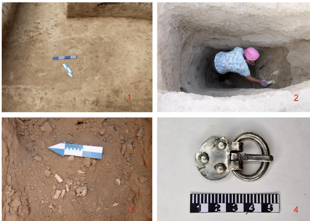
3-Сурет. 1 – Дромостың сұлбасы. 2 – Дромосты тазалау сәтінен көрініс. 3 – Дромостан табылған ірі қара малдың жақ сүйегі. 3 – Камерадан табылған күміс тоға.

адамның жекелеген сүйектері жатты. Нәтижесінде бұл обаның тоналғандығы белгілі болды.