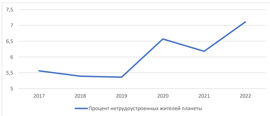
Сурет 1. Пандемияның жұмыссыздықтың таралуына әсері

Осы проблемалардың ішінде жұмыссыздық мәселесі ең күрделі болып табылады, өйткені халықты жұмыспен қамту экономикалық қызметтің басқа салаларына әсер етеді. Осылайша, пандемияның жұмыссыздықтың таралуына қалай әсер еткенін түсіну үшін келесі кестеге назар аудару керек.