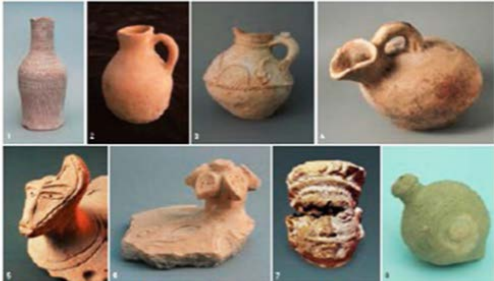
Сурет 2. Құлан қаласынан табылған керамика кешені терракоталық тақталар