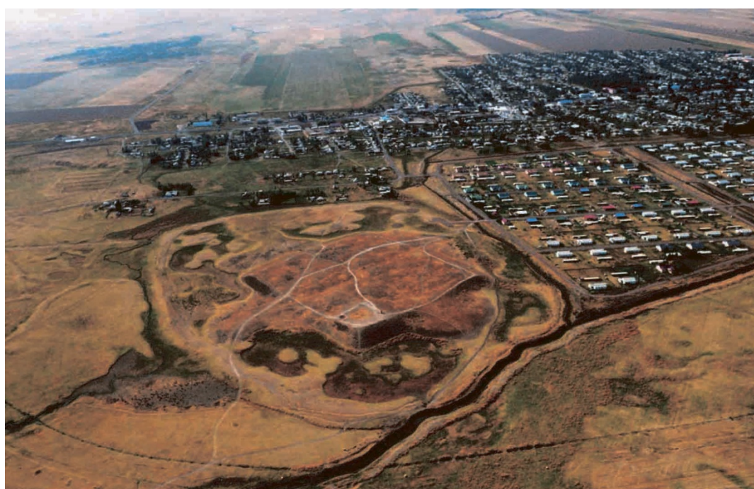
Сурет 1. Ортағасырлық Құлан қаласының аэросуреті