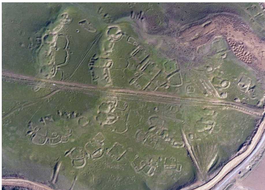
Сурет 1 – Келес өзені бойындағы ежелгі қоныстардың көрінісі.

де айналысқандығын, тіпті қалалар тұрғызысып, өңірдегі алғашқы қалалық мәдениетті қалыптастырғандығы жайлы көңілге қонымды пікір айтқан [5, 8].