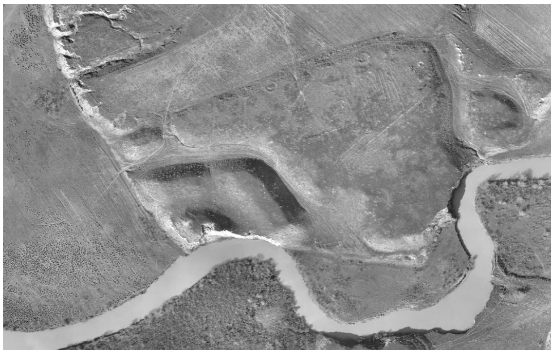
Сурет 2 – Күлтөбе қалашығының әуеден көрінісі.