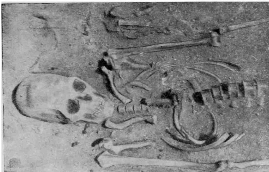
Сурет 3. Челябинск облысы. Ресей. Магнитогорск қаласы. Мало – Кизыльский қорымы. №1 оба. Бс сүйегі ұзын сопақ пішінде деформацияланған қаңқа (сармат кезеңі) [47, 117].

Қызылорда облысындағы Қуандария өзені жағасында Алтынасар қорымы орналасқан. Бұл қорымнан кейінгі сармат кезеңінің ерекшеліктерін көрсететін көптеген жерлеулер аршылған. Дегенмен ғалымдар аймақтағы осындай ескерткіштердің барлығын топтастырып, оны қаңлы мәдениетінің тармағы ретінде белгілеп оған Жетінасар мәдениеті деген атау берген. Ендігі кезекте Алтынасар қорымындағы 52 обада анықталған жерлеуге қысқаша тоқталып өтейік. Аталмыш обадағы қаңқа солтүстікке бағытталып органикалық төсенішке жатқызылған. Бас сүйегі деформацияланған бұл қаңқаның жанына жылтырата тегістелген саз ыдыс пен қоса қойдың алдыңғы аяғы салынған. Қабірдің бір бұрышына қойдың бір аяғымен қоса темір пышақ салу «сармат жерлеулеріне» тән ерекшелік болып табылады. Зерттеушілер Алтынсардағы жерлеулердің көпшілігін б.з. 3-4 ғасырларға мерзімдеген [50, 108]. Бас сүйегі жасанды түрде өзгертілген қаңқалар Қазақстанның батыс өңіріндегі обалардан да табылған. Археологтар мұны кейінгі сармат кезеңіне (б.з. 2-4 ғғ.) жатқызған.