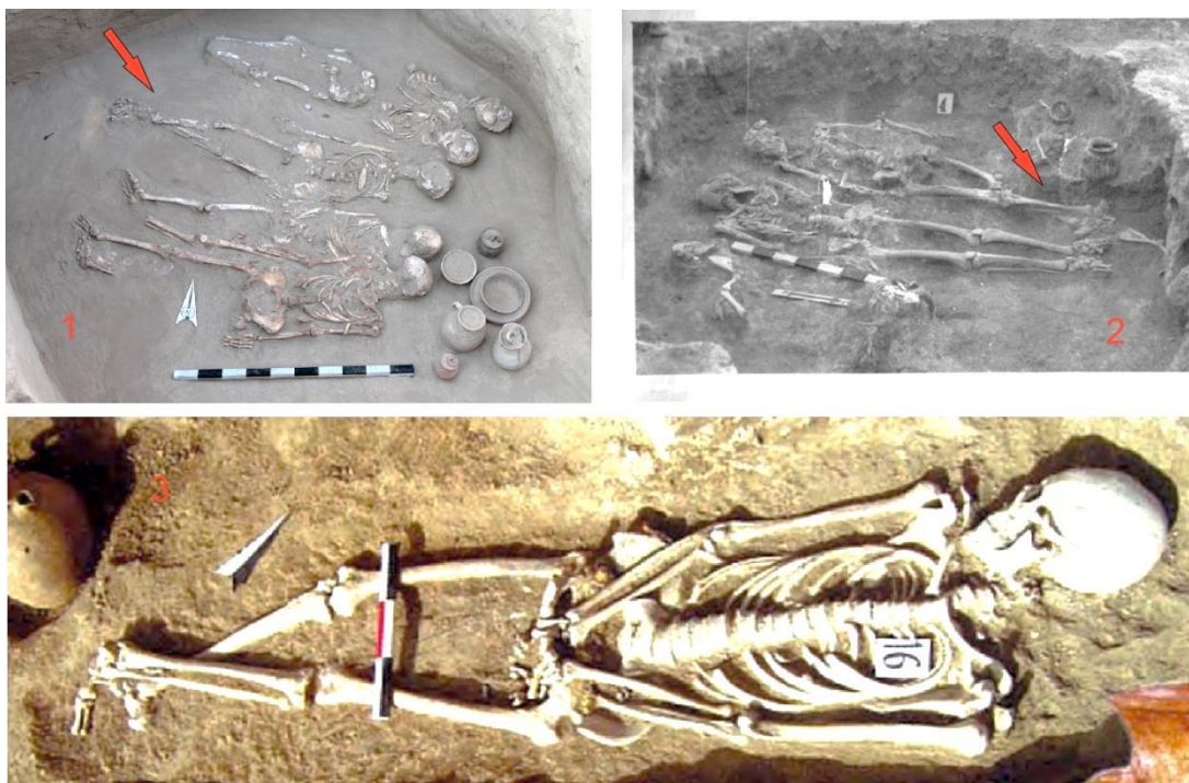
Сурет 2. 1 – Келес ауданы. Мыңтөбе қорымы. №3 обадағы аяғы айқасқан қалыптағы жерлеу (қаңлы кезеңі) [35]; 2 – Орал қаласы. Шалқар қорымы. №4 обадағы аяғы айқасқан қалыптағы жерлеу (сармат кезеңі) [37]; 3 – Отырар ауданы. Қоңыртөбе қорымы. №106 жерлеу (қаңлы кезеңі) [34].

Біздің жыл санауымыздың бас кезінде кең байтақ Еуразия даласында және Қазақстан аймағында ғылымда «Халықтардың ұлы қоныс аударуы» деген атпен белгілі болған саяси оқиға орын алған. Бұл тарихи оқиғаға ғұндардың батысқа және оңтүстікке қарай жылжыуы себеп болды деген пікірлер бар (1-карта). Ғұндардың оңтүстікке жылжыған топтары «ақ ғұн» деп аталған. Ақ ғұндар ұзақ жылдар бойы жүргізген соғыстан кейін Сасанидтерді жеңеді. Осы соғыстардан кейін парсылар бір ғасыр бойына ғұндарға бағынған. Ақ ғұндар империясы Орта Азияға ұзақ жылдар бойы билік жүргізіп ғұн мәдениетінде өзіндік із қалдырған. Ғұндар басқа аймаққа қарай жылжыған кезде кейбір тайпаларды бағындырса, кейбірін өздеріне қосып алған. Аталмыш тайпаның Қазақстанға екінші рет қоныс аударуы б.з. 93 жылы жүзеге асқан. Ғұндар Сырдария, Арал жағасына, Орталық Қазақстан мен Батыс Қазақстанға дейін келіп жеткен. Мұны жергілікті тайпалардың материалдық және рухани мәдениетінде орын алған кейбір өзгерістер дәлелдейді [9, 97]. Мысалға осы кезеңге жататын қаңлы ескерткіштеріннен полихромдық стильдегі ғұн әшекейі, ғұн түріндегі қола қазан, сүйектен жасалған садақ және т.б. айтпағанда бас сүйегі деформацияланған қаңқалар табыла бастайды. Жоғарыда да айтып өткеніміздей ғалымдар бұл өзгерісті ғұндармен байланыстырады. Бұл пікірді Уддиян аймағынан табылған беткі жағында эфталит патшасы бас сүйегі деформацияланған кейіпте бейнеленген монета дәлелдесе керек [10, 12].