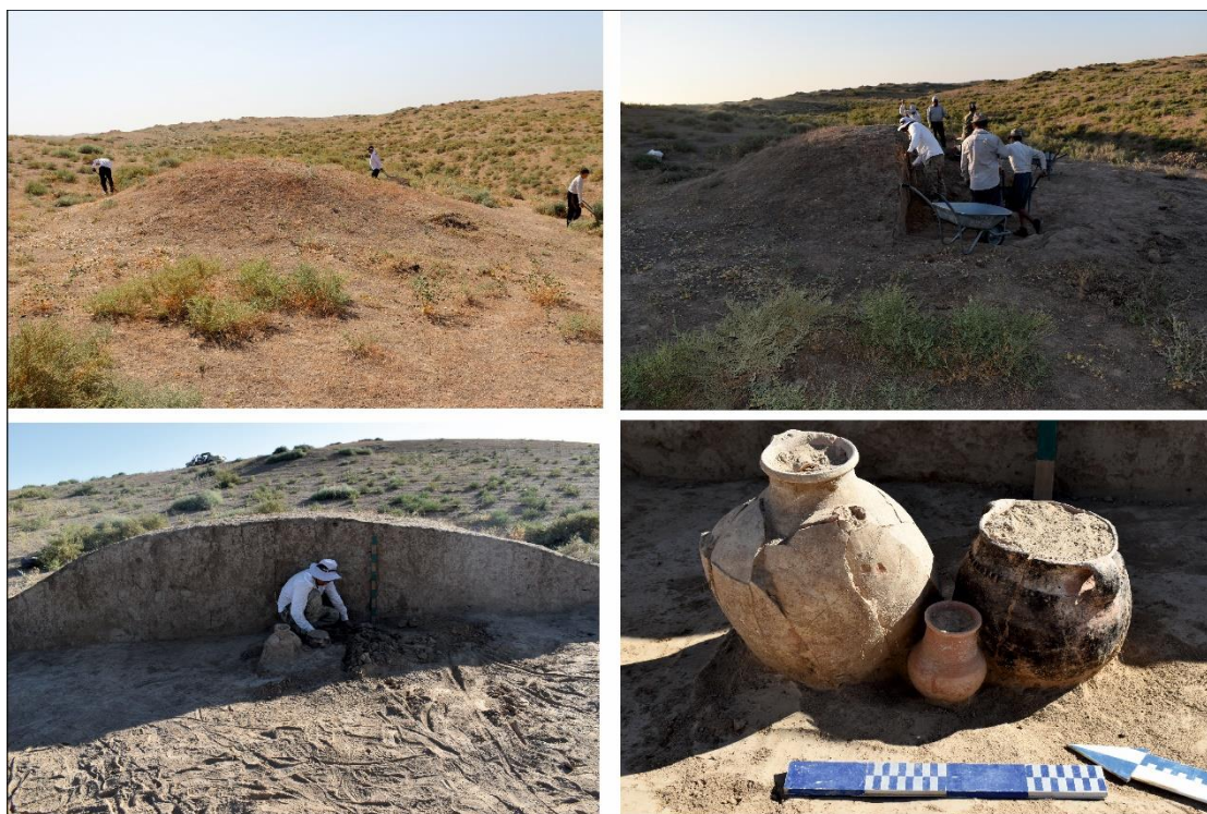
1-сурет. Мыңтөбе қорымы. №7 обада жүргізілген зерттеу жұмыстарынан көрініс

Дегенмен топырақтың қысымынан болса керек шүмекті құмыра мен көзе жарылып бүлінген. Шүмекті құмыраның сыртқы бетіне батырып сызу арқылы толқынды өрнек салынған. Биіктігі 40 см, түбінің диаметрі 22 см, мойнының биіктігі 5 м, ернеуінің диаметрі 13 см. Сырты қарайып отқа күйген көзенің мойнына лайдан таспа жабыстырылып, оның беті саусақпен басылған. Биіктігі 22,5 см, түбінің диаметрі 20 см, мойнының биіктігі 3 см, ернеуінің диаметрі 20 см. Ал, сырты қызыл ангобты көлемі кіші құмыраның биіктігі 13 см, түбінің диаметрі 6,5 см, мойнының биіктігі 3 см, ернеуінің диаметрі 8 см. Археологиялық олжалар суретке түсіріліп құжатталғаннан кейін қазба жұмысы қайта жалғасын тапты. Оба үйіндісі астынан аршылған аумақ қыру арқылы тазаланып қабір дағы іздестірілді. Дегенмен саз ыдыс тұрған жермен маңайынан ешқандай із байқалмады. Осыдан кейін обаның дәл орта тұсы реперлік нүктеден төмен қарай 3 м-ге дейін тереңдетіле қазылды. Нәтижесінде бұл тереңдіктен де жерлеу ізі анықталмады. Осы сәттен бастап қазба шекарасы обаның