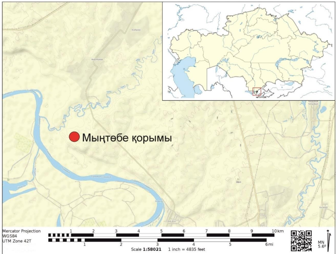
Карта. Мыңтөбе қорымының географиялық орны