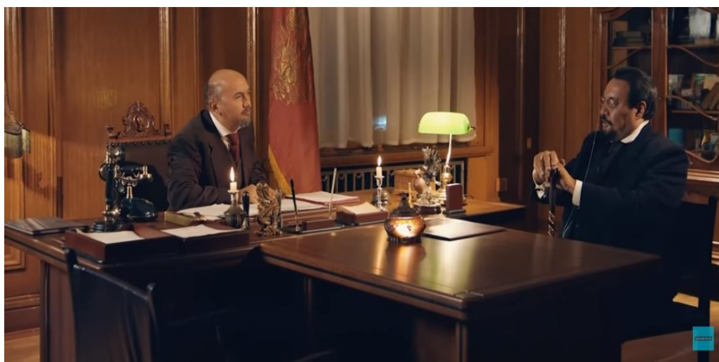
10 сурет «Ахмет ұл ұстазы» сериалынан үзінді