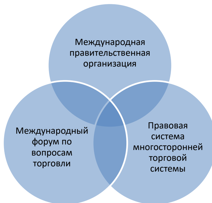
Рис. 3 – Механизм ВТО

В целом можно говорить о сложности и многоуровневости правового механизма ВТО и построения всей правовой системы международной торговли. В наиболее общем виде механизм Всемирной торговой организации можно схематично представить следующим образом: