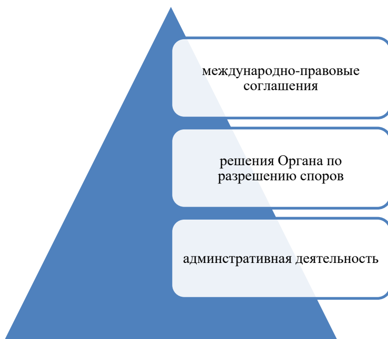
Рис. 2 – Источники права ВТО

На сегодняшний момент полностью оформилась правовая платформа ВТО, в которой выделяются три основных источника права.