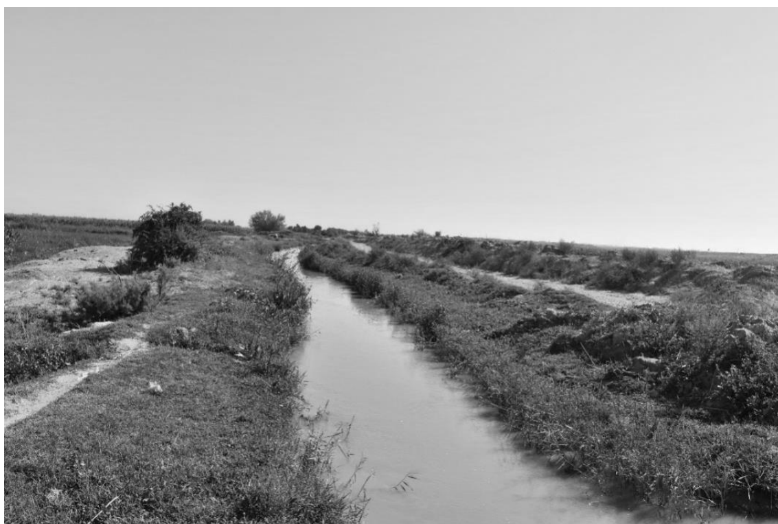
4-сурет. Маңғыт арық. Түркістан облысы, Келес ауданы, Қызыләскер ауылы. 2021 ж.

арнасындағы судың тереңдігі 15 см, жалпы биік тұсы 70 см. Ал, арықтан оқарыққа 13 дейінгі тартылған су арнасының ұзындығы 12-13 м болып, тіке немесе жердің ыңғайына қарай бұрылып қазылады [4].