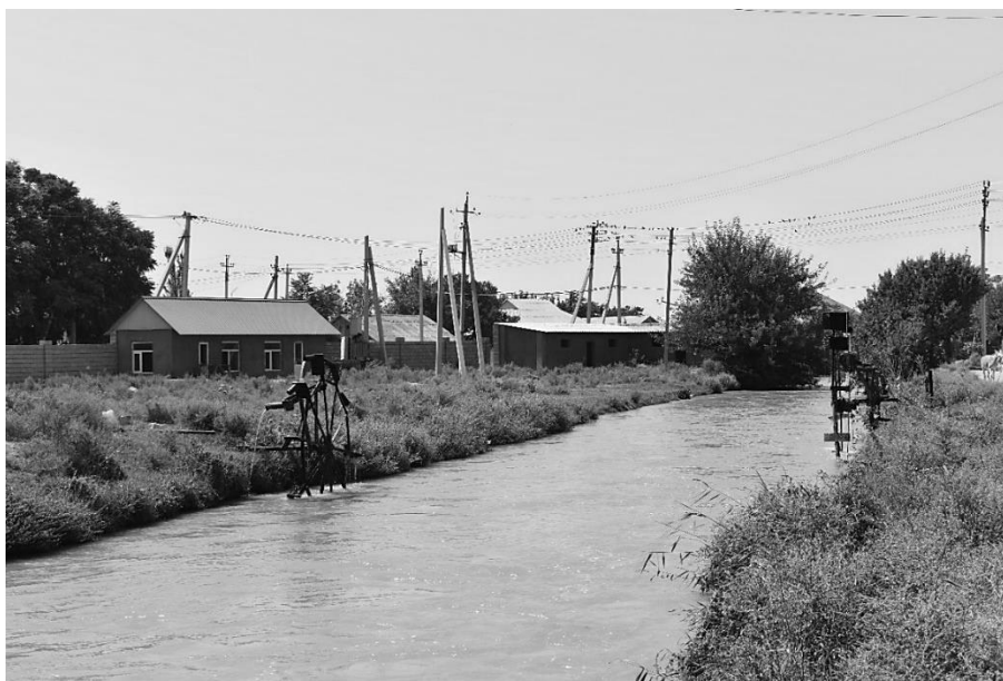
3-сурет. Ошақты каналы. Түркістан облысы, Келес ауданы, Абай ауылы. 2021 ж.