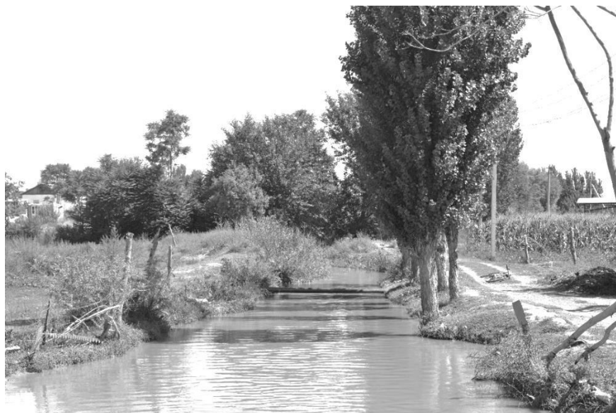
5-сурет. Оймауыт арық. Түркістан облысы, Келес ауданы, Көгертү ауылы. 2021 ж.