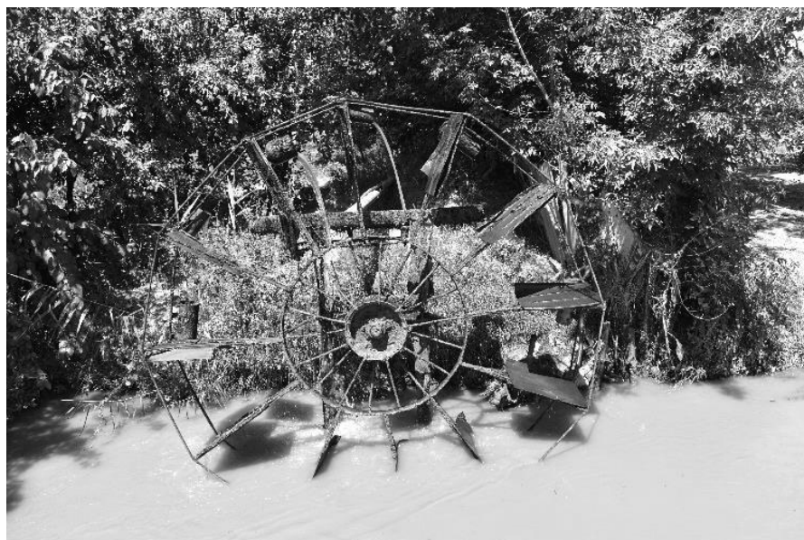
6-сурет. Оймауыт арыққа орнатылған су шығыр.

Қият арық өзінің сағасын Маңғыт арықтан алады. Ұзындығы бар-жоғы 1 шақырым ғана болатын шағын арық. Ауылы аралас, қойы қоралас мекен еткен Қият руының 14 Маңғыттардан суы алуы заңдылық еді. Қыз алысып, қыз берісіп жүрген рулардың арасында шаруашылық мақсатында келісімдер жүзеге асып отырған (I). Яғни, рулар арасында арықтағы суды пайдалануға байланысты шаруашылық-экономикалық қарым-қатынастар аясында шешілген.