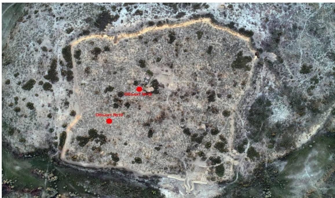
2-сурет. №18 және №19 нысандардың орны.

Өткен жылғы далалық маусымда қазба жұмыстары бірнеше бөлікте атқарылды. Біздер қазба жүргізген нысанға 2019 жылы барлау кесігі салынып, №19 деген шартты атаумен белгіленген болатын [22, 17]. Бұл нысан оңтүстік қақпамен жалғасып жатқан магистралды көшеден батысқа қарай бағытталған тарам көшенің жиегінде, қаланың батыс жақ қамал қабырғалары маңында орналасқан (2-сурет).