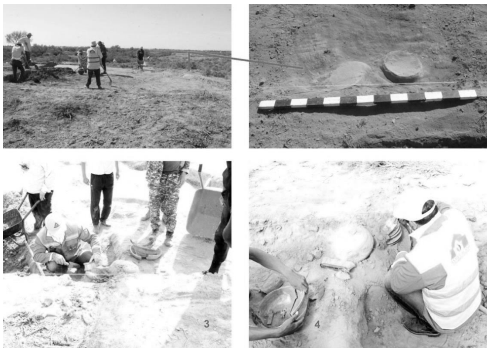
3-сурет. 1-Қазба жиегінде тұрған қыш ыдыстар; 2-Төңкерілген екі қыш ыдыстың көрінісі; 3-Ыдыстарды тазалау сәтінен көрініс; 4-Қыш ыдыстардың астындағы тостақтарды тазалап алу сәтінен көрініс.

Төңкерілген қыш ыдыстармен мен жерлеулердің бірінші қабат деңгейінен табылуы, ыдыстардың кездейсоқ төңкерілмегендігін көрсететіндей. Өйткені ыдыстар кезінде күндізгі жер бетіне төңкеріліп қойылғанға және уақыт өте келе үстін үрме топырақ көмкеріп қалғанға ұқсайды. Бұл жағдай біздерді аталмыш екі қыш ыдыстың 30 см тереңде анықталған қаңқаларға немесе осы жерде әзірге анықталмаған қандайда бір жерлеуге арналған болу керек деген болжам жүргізуге итермеледі. Осы жайт археологтардың назарын өзіне тартып «қазан төңкеру» жоралғысы жайында зерттеу жүргізуге жол ашты. Нәтижесінде аталмыш жоралғының түп тамырының тереңде екендігі және этнографиялық кезенге дейін жалғасын тапқандығы анықталып төмендегідей қорытынды шығаруға негіз болды.